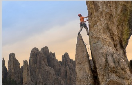
Berg steigen klettern