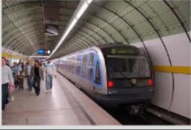
mit der U-Bahn