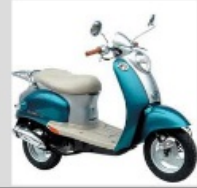
mit dem Moped