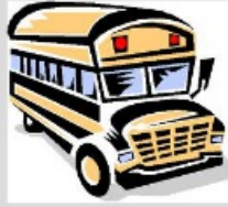
mit dem Bus