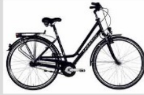
mit dem Rad