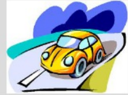
mit dem Auto