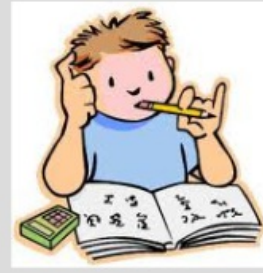
Hans 15 Deutschland