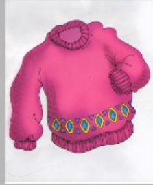
der Pulli der Pullover