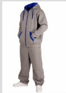
der Jogging- Anzug