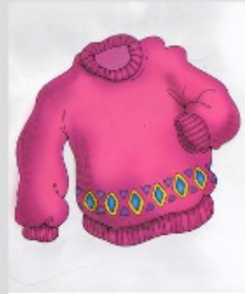
der Pulli der Pullover