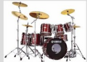
das Schlagzeug der Trummel